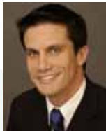
D. Field Gérant

L'expertise Carmignac pour capter les véritables opportunités dans le secteur des ressources naturelles